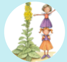
Königskerze Die Königliche