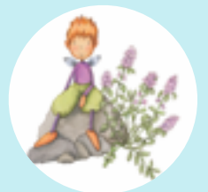
Thymian Der Ritterliche