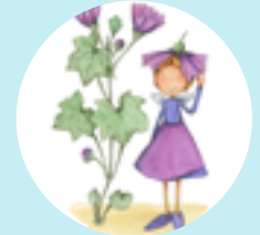
Malve Die Schüchterne

Erlebt mit der kleinen Elfe Taty und ihren Freunden einen Sommer in Vinlanda. Mit vielen lustigen Gedichten, spannenden Geschichten und Wissenswertem über Heilkräuter und Heilpflanzen und natürlich tollen Rezepten zum Ausprobieren.