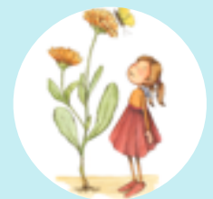
Ringelblume Die Lustige